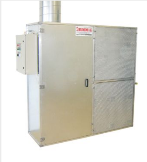
OPTION - Lackierraum Zuluftgerät mit Heizregister für beheizte Nachströmluft

Zuluftanlagen für Farbnebelabsauganlagen, das heisst: beheizte, staubfreie Zuluft = weniger Staub