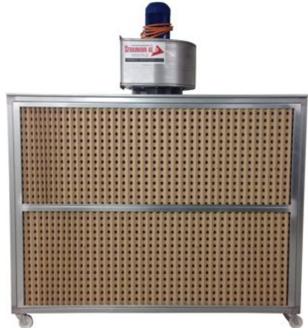
LC 6000 mit 2.0 x 1.50 m Filter, 7'000 m3h Abluftleistung Beispiel Grundmodell mit Ventilator oben - LC 6000 VO