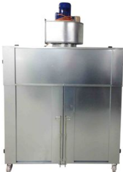
bei Nichtgebrauch kompakt verschlossen

Filterwände mit über 30 Modelle, mit diversen Ventilator-Varianten lieferbar - Fragen Sie uns an wir beraten gerne. - * Die Absaugleistung ist abhängig vom Filter-Verschmutzungsgrad, Abluftrohrlänge und -querschnitt. - Technische Änderungen vorbehalten