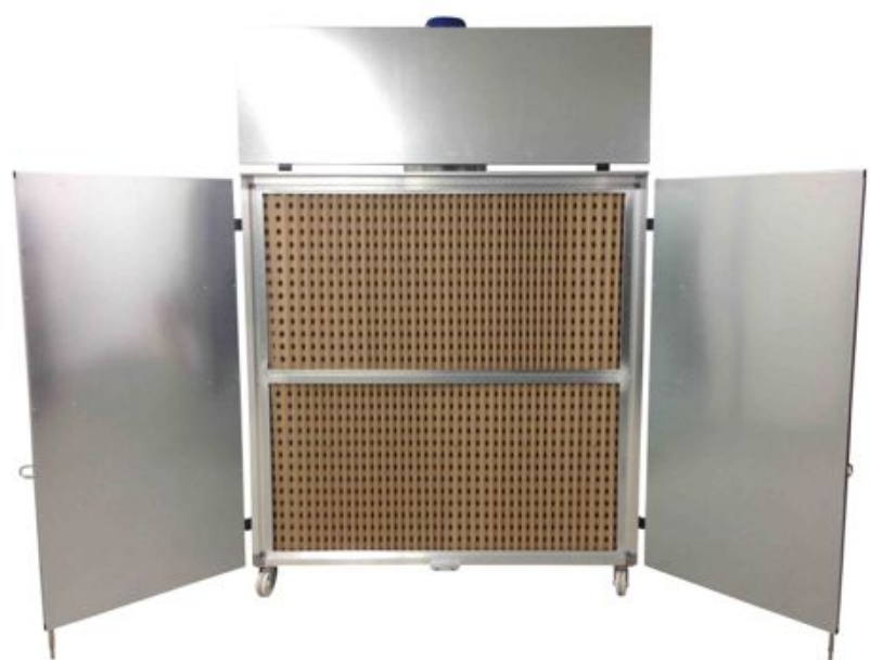
betriebsbereit mit optimaler Farbnebel erfassung und viel Arbeitsbreite