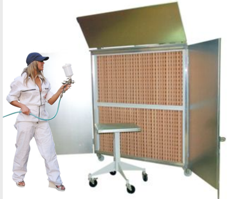
LC 4000 1.5 x 1.5m Filterfläche Seitentüren und Leitblech