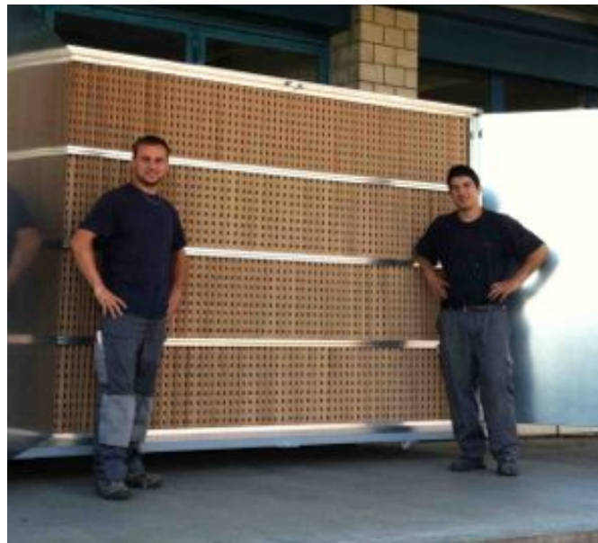
LC 7000.32 mit 3.0 x 2.0 m Filter, 14'000 m3h Abluftleistung