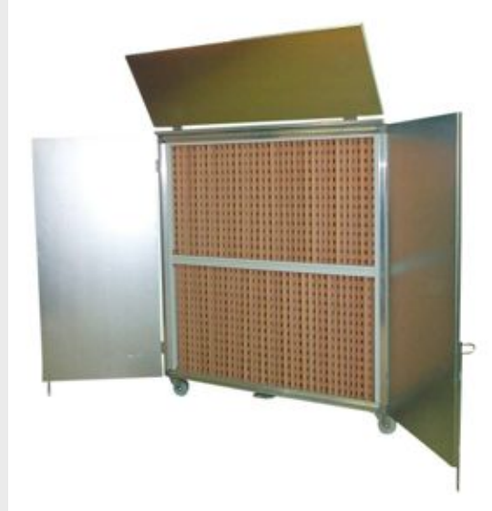
Bilder / Beispiel: LC 4000 betriebsbereit, mit seitlichen Türflügel und Leitbleche geöffnet