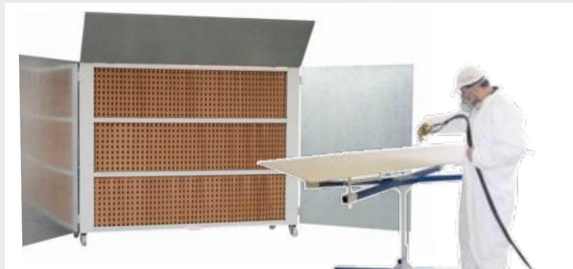
SAW 6000 mit vier Stufen Filter, Türflügel, Leitblech