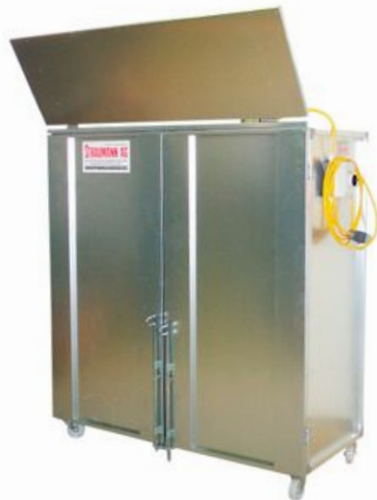
LC 4000 1.5 x 1.5m Filter, mit Ventilator, Kabel, Schalter