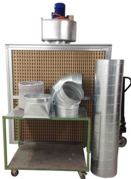
Abluft-Rohrteile, normiert, nach Mass, flexibel