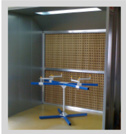
Spritzstand Typ BTK